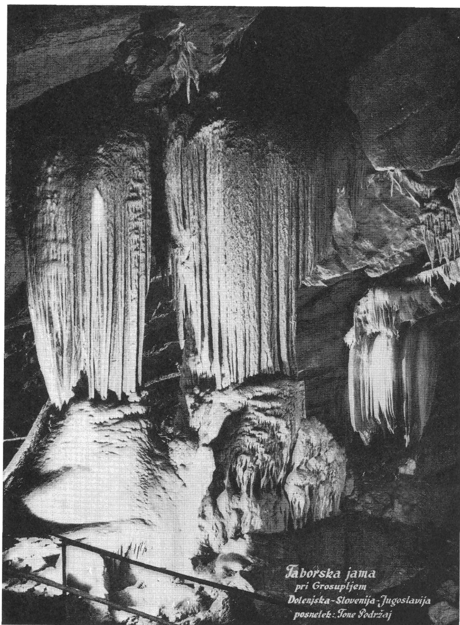
Jaborska jama pri Grosupljem Dolenjska - Slovenija - Jugoslavija